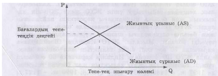
Сурет 1 ЖИЫНТЫҚ СҰРАНЫС ПЕН ЖИЫНТЫҚ ҰСЫНЫС МОДЕЛІ

Тұтынатын ЖҰӨ-нің серпініне (динамикасына) бағалық, сонымен бірге бағалық емес факторлар әсер етеді. Бағалық факторлардың әсері тауарлар мен қызметтерге жиынтық сұраныстың көлемінің өзгеруі арқылы жүзеге асады және AD қисығының бойымен қозғалу кестесі арқылы көрсетіледі. Бағалық емес факторлар жиынтық сұранысты AD қисығын солға немесе оңға қозғау арқылы өзгеріске келтіреді.