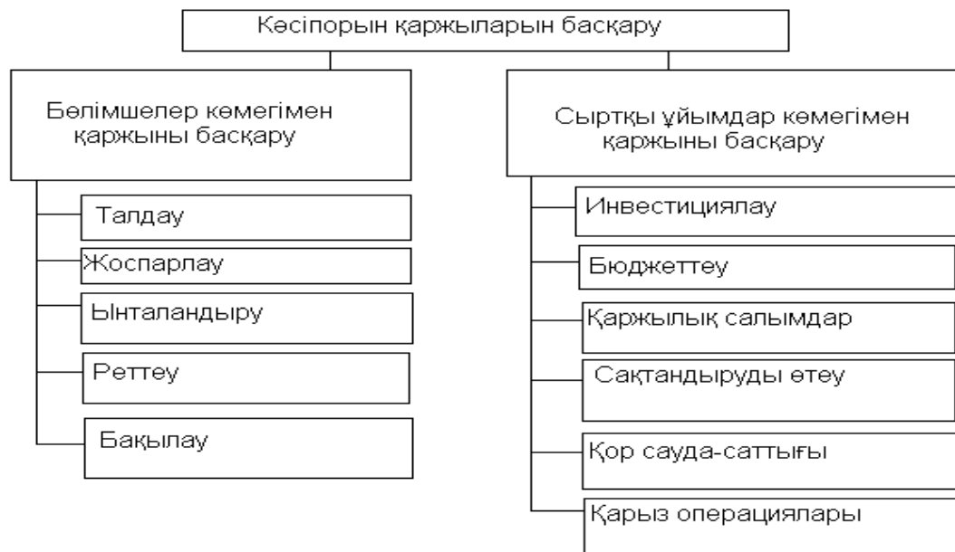
Сурет1. Кәсіпорын қаржыларын басқару әдісі

Суреттен көріп отырғандай кәсіпорын қаржысын басқаруда екі негізгі элементті бөліп көрсетілген, біріншісі – ішкі бөлімшелер көмегімен қаржыны басқаруды, ал екіншісі басқа кәсіпорындардың көмегімен тартылатын қаржылық ресурстарды басқару көрсетілген. [4]