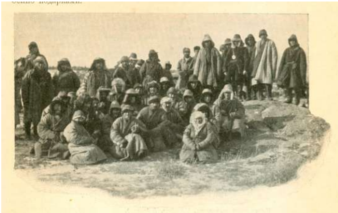
Съезд киргизов по выбору биев