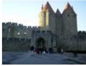
La cité de Carcassonne