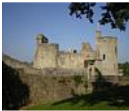
Le château de Clisson