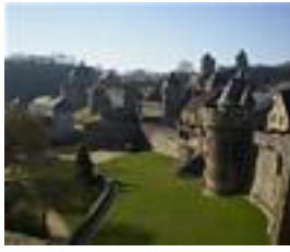
Le château de Fougères