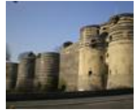
Le château d'Angers