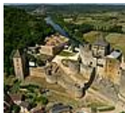
Le chateau de Castelnaud