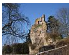
Saint-Aubin du Cormier