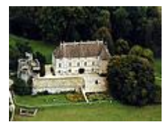
Le Château de Germolles