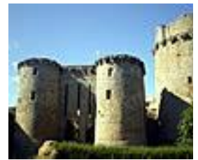
Le château de Tonquédec