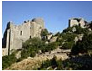
Le château de Peyreperthus