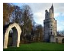
Le Château de Septmonts