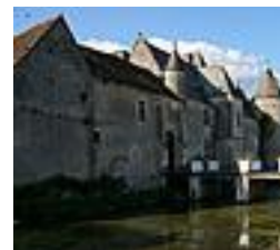
Le Chateau de Chémery