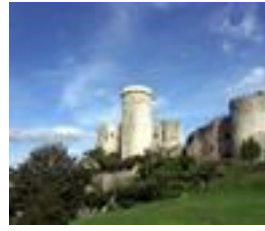
Le château de Falaise