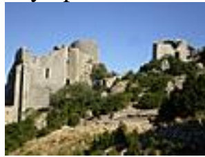
Le château de Peyreperthus