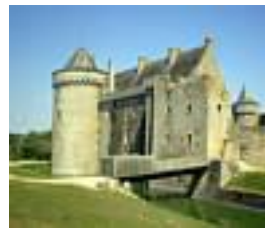
Le château de Suscinio