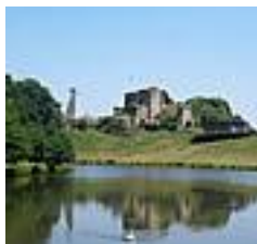
Le Chateau de Tiffauges