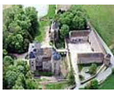
Le Château de Ruffey