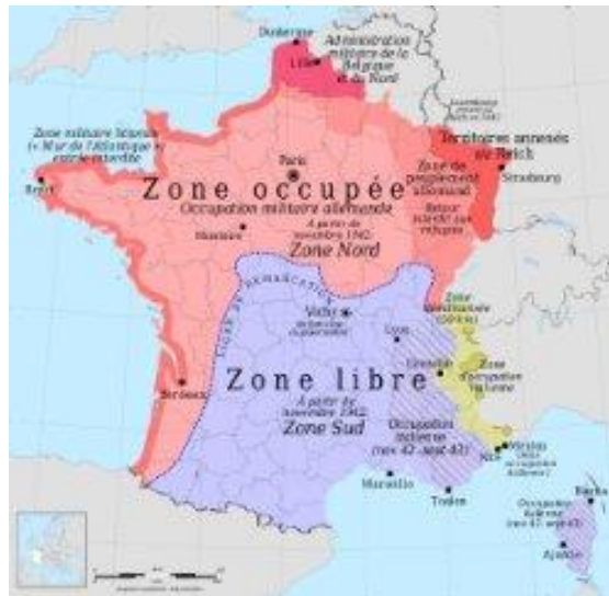
La carte de France détaillée