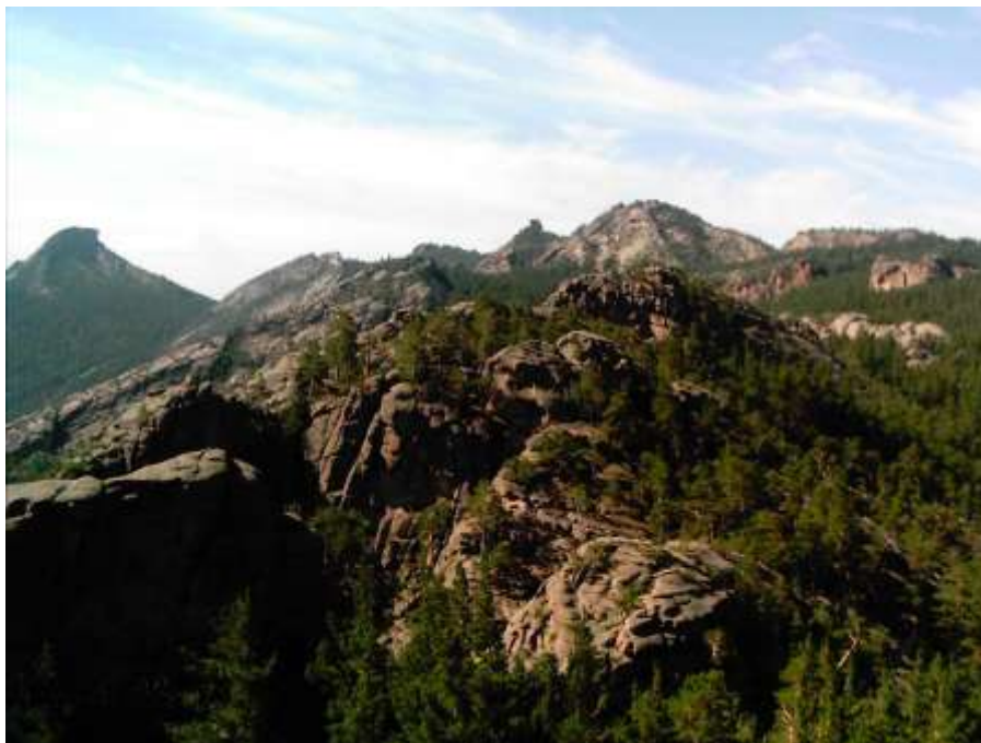
Қарқаралы мемлекеттік ұлттық табиғи саябағы

Сирек кездесетін өсімдіктер түрі — 66, негізінен орман тұқымдас: қарағай, қайың көктерек, тал, арша және т.б. ағашты-бұта тектес түрлері өседі. Ал қарқаралы бөріқарақаты (барбарис), мүк сияқты өсімдіктің түрлері де Қызыл кітапқа енгізілген.