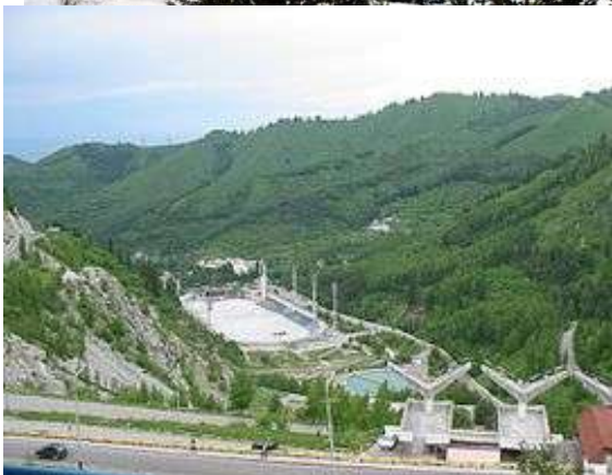
Медеу мұз айдыны