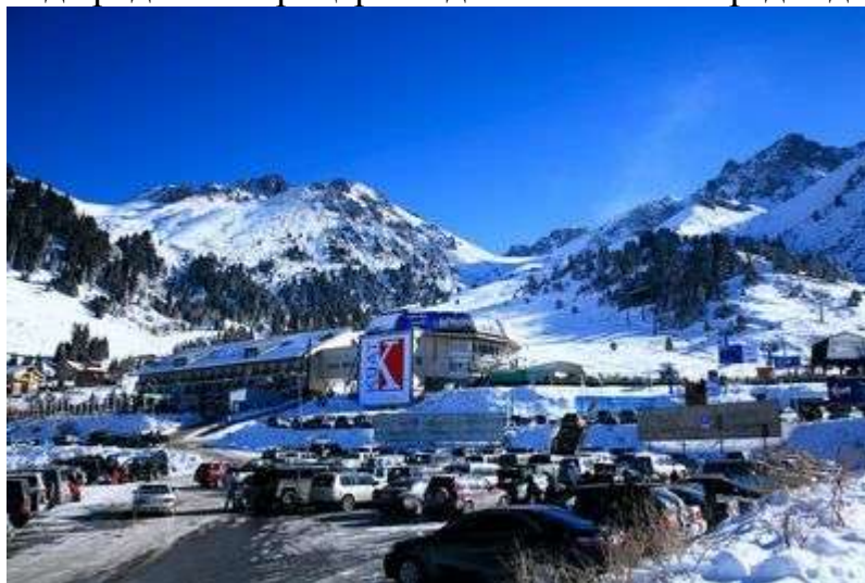
Шымбұлақ тау шаңғы курорты

Шуақты күндері Шымбұлаққа мыңдаған демалушылар ағылып келіп жатады. Отырғышы бар көтермелермен Талғар асуына (теңіз деңгейінен 3163 м биіктіктегі) шығуға болады. Бұл кәсіби шаңғышылардың ұнататын жері, өйткені мұнда асудан түсетін жер өте тік. Талғар асуынан альпинистер шыңдарды бағындырады. Ал әрі қарай одан биік – тек жұлдыздар.