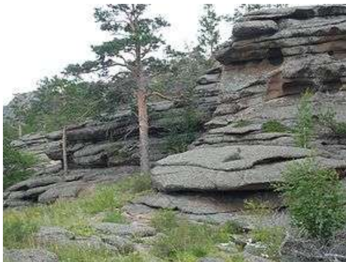
Баянауыл ұлттық паркі